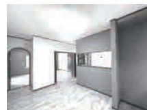
▲ダイニングキッチン