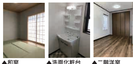
▲和室 ▲洗面化粧台 ▲二階洋室