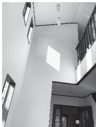
開放感のある吹き抜けで玄関広々