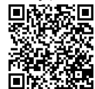
スマホで物件内覧