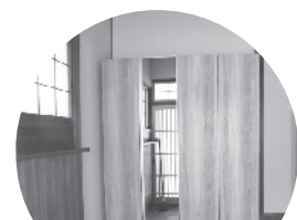
大容量のシューズボックスを設置しました