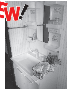
新品の洗面化粧台